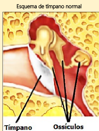
Esquema de tímpano normal